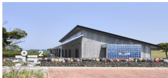
世界海洋プラスチックプランニングセンター外観

同センターは、海洋プラスチック問題を解決に導くために設置された世界初の海洋プラスチック専門拠点で、佐賀県と包括連携協定を締結し、地域課題の解決や地方創生に向けた活動を支援する当社にとって、このたびの感謝状は光栄であり大きな喜びであります。造船業を営む当社にとって海はかけがえのないものであり、同センターが海洋プラスチック問題解決の最前線基地として発展されることを祈念いたします。