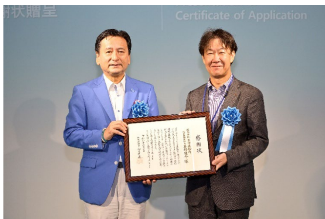
感謝状贈呈式の様子